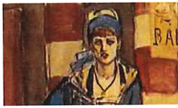
La « buveuse d'absinthe ».

La quasi-totalité de la famille Dorville avait succombé aux exactions nazies durant la guerre. Septante-cinq ans après la fin du conflit, cette question de la restitution des œuvres d'art confisquées par les nazis et revendues par la suite n'a toujours pas connu de résolution, tant l'identification des propriétaires spoliés (la plupart ont été assassinés) est complexe et tant les œuvres sont dispersées aux quatre coins du monde.