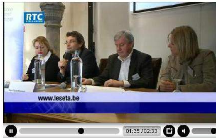
Reportage de RTC Télé-Liège visible à partir du site de l'EWETA www.eweta.be à la rubrique « PRESSE »

Le lancement de la campagne de promotion des ETA wallonnes – initiée en 2009 – a été officialisé par la présentation du nouveau moteur de recherche des ETA wallonnes lors de la conférence de presse qui a eu lieu le 20 janvier 2010 à Liège en présence des Ministres TILLIEUX et MARCOURT.