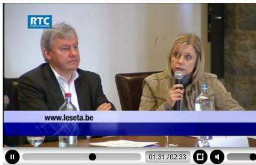
Reportage de RTC Télé-Liège visible à partir du site de l'EWETA www.eweta.be à la rubrique « PRESSE »

Au cours de son intervention, le Ministre wallon de l'Economie, de l'Emploi et du Commerce extérieur a insisté sur l'importance des ETA et du secteur de l'économie sociale tout entier : « L'économie sociale est un secteur d'activité de plus en plus essentiel dans la mesure où il répond aux besoins que les entreprises classiques ont peine à satisfaire. Les entreprises de ce secteur maintiennent dans le circuit de l'activité des travailleurs moins qualifiés ou victimes de handicap, avec d'autres principes fondateurs et éthiques que ceux des autres entreprises. Je suis heureux d'avoir contribué au financement de ce site car il permettra aux entreprises traditionnelles et au grand public de mieux connaître le quotidien des ETA. Il faut montrer qu'elles ne sont pas des entreprises « bas de gamme ». Enfin, ce site participe au décloisonnement entre les univers. On vit trop à côté des autres et non avec. »